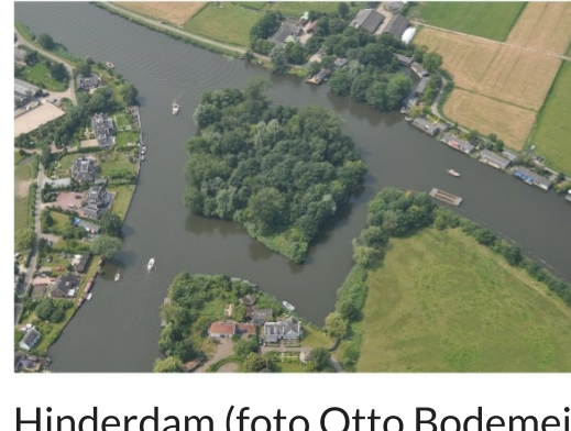
Luchtfoto fort bij Hinderdam

Hinderdam